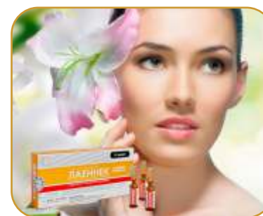
Лаеннек / Laennec

Рекомендуемый курс: 3 процедуры с интервалом 1 раз в две недели.