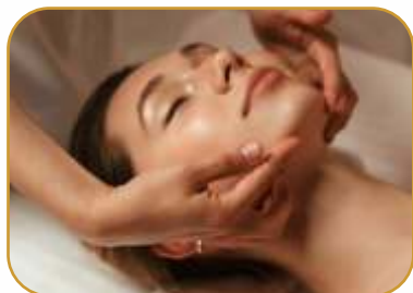
Классический массаж лица

Выполняется для проблемной кожи либо после механической чистки лица, для успокоения и быстрого восстановления кожи.