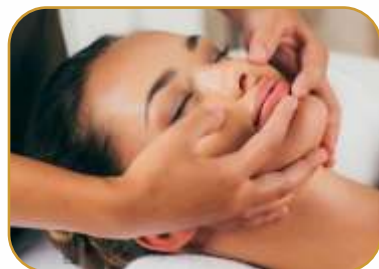
Лечебный массаж лица